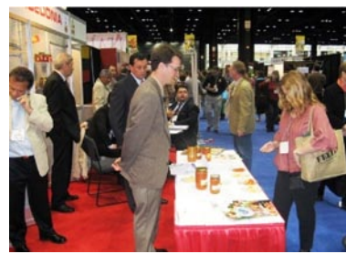
Потрошувачите во САД дегустираат македонски ајвар на саемот во Чикаго “Chicago Global Food & Style Expo”, 2008 година

Иво Лола Рибар 57/3 1000 Скопје, Македонија, телефон: +389 2 321 7060 Факс: +389 2 321 7060, Лок.111 www.agbiz.com.mk