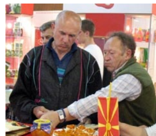
Потрошувач во Србија дегустира македонски производи од пиперка на 75-от Земјоделски саем во Нови Сад