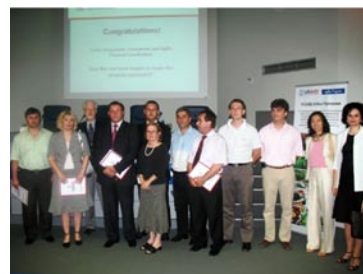
Првата церемонија за потпишување на договори за грантови во Скопје