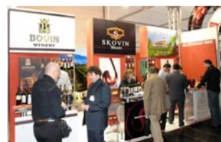
Македонскиот штанд на “ProWein” меѓународниот саем за вино во Диселдорф, Германија