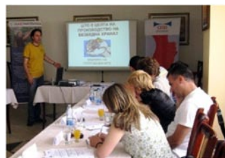
Работилница за НАССР системи во Кавадарци за имплементација, верификација и одржување во винската индустрија