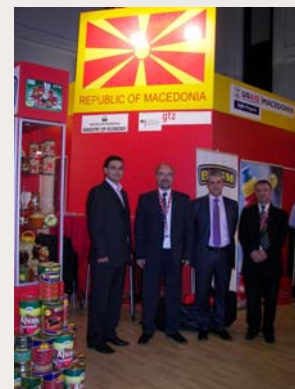
Претставници од фирмите на македонскиот штанд на Ануга

Вкупниот трошок за трговскиот саем изнесуваше 112.044 УСД, а АгБиз учествуваше со 8%.