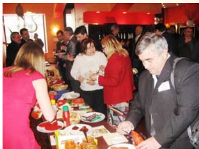
Дегустација на македонски производи на промотивниот настан во Чешка

Во партнерство со МАП, АгБиз програмата на УСАИД поддржа десет македонски фирми, преработувачи на зелчук и овошје, да посетат неколку малопродажни маркети во Прага и нејзината околина, меѓу кои и Tesco, Makro, Billa и Globus. Студиската посета на Чешка се одржа од 26 до 29 јануари. Најголемите македонски извозници на преработки од пиперки ја имаа таа можност да ги идентификуваат најрелевантните производи, цените, видот на амбалажата, начинот на етикетирање; да ги презентираат своите производи на настанот што беше организиран во соработка со македонската амбасада во Прага; и потоа да се сретнат со потенцијалните клиенти и да разговараат за можностите за продажба.