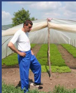
Производител на пиперки

На настанот присуствуваа 35 учесници, меѓу кои и претставници на фирмите преработувачи на зеленчук, здруженијата и синдикатите на земјоделци, МЗШВ, Факултетот за земјоделски науки и храна и АгБиз програмата на УСАИД.