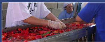
Преработка на пиперки